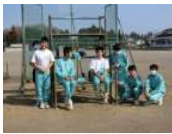
試合の合間、ひと休み