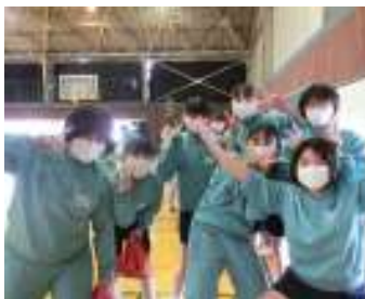
ドッジボール優勝2組