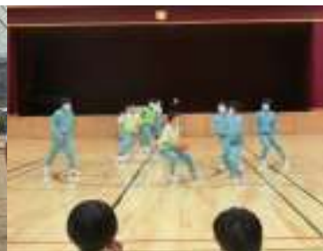
男子バスケットボール