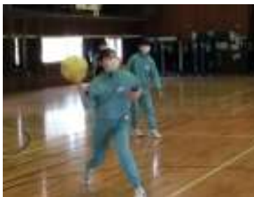
女子ドッジボール

男子…バスケットボール 1位2組 2位3組 サッカー 1位4組 2位3組 女子…バスケットボール 1位2組 2位3組 ドッジボール 1位2組 2位4組