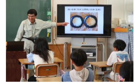
▲お米について講話