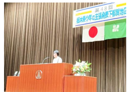
少年の主張下都賀大会 8/21