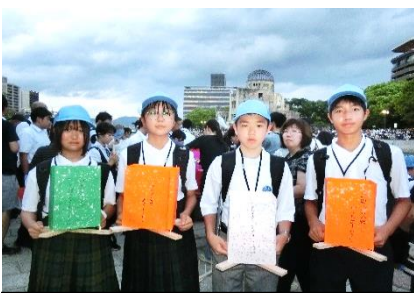
広島平和祈念式典派遣 8/5～8/7

エニスホールで行われた少年の主張下都賀地区大会では、3年生 _____ さんが「『考える』が未来をつくる」と題し、堂々とした発表を行いました。野木中の代表生徒の潤心祭での報告や発表が今から楽しみです。